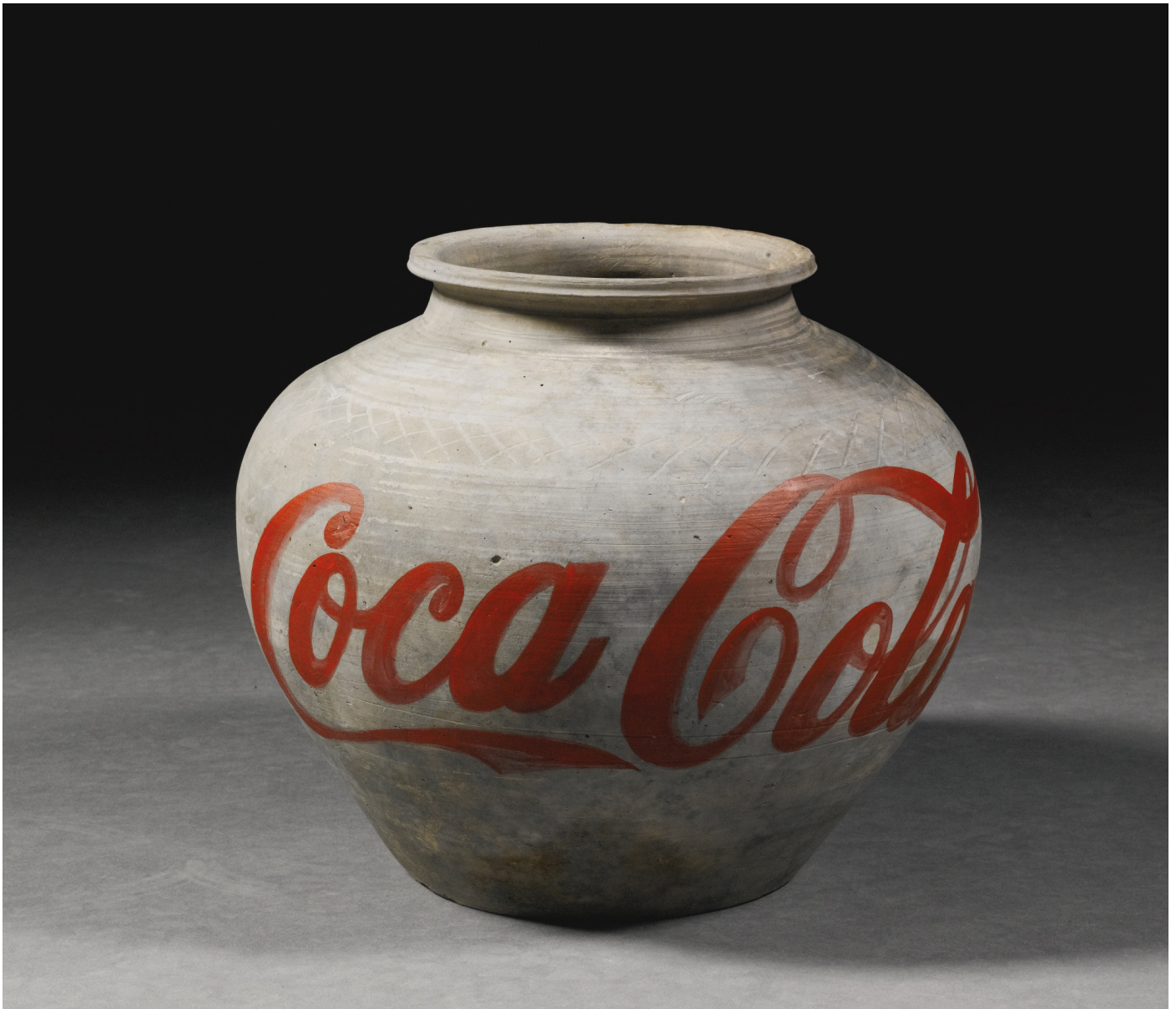
Ai Weiwei , Urne de la dynastie Han peinte avec le logo Coca Cola , argile, peinture, h: 25 cm, ø 28 cm, 1995 Collection privée