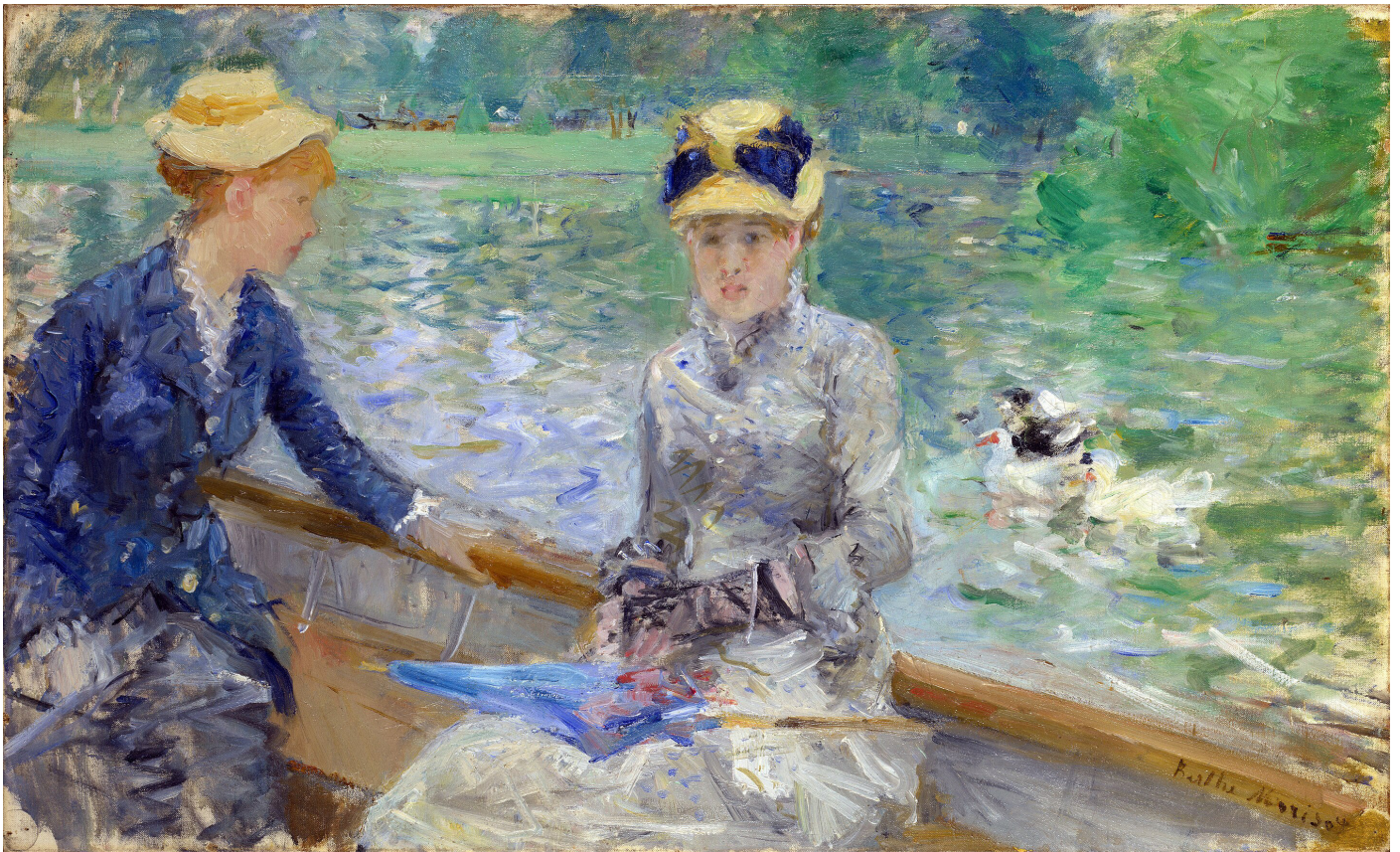
Berthe Morisot , Jour d'été , huile sur toile, 45,7 cm x 75,2 cm, 1879 National Gallery, Londres