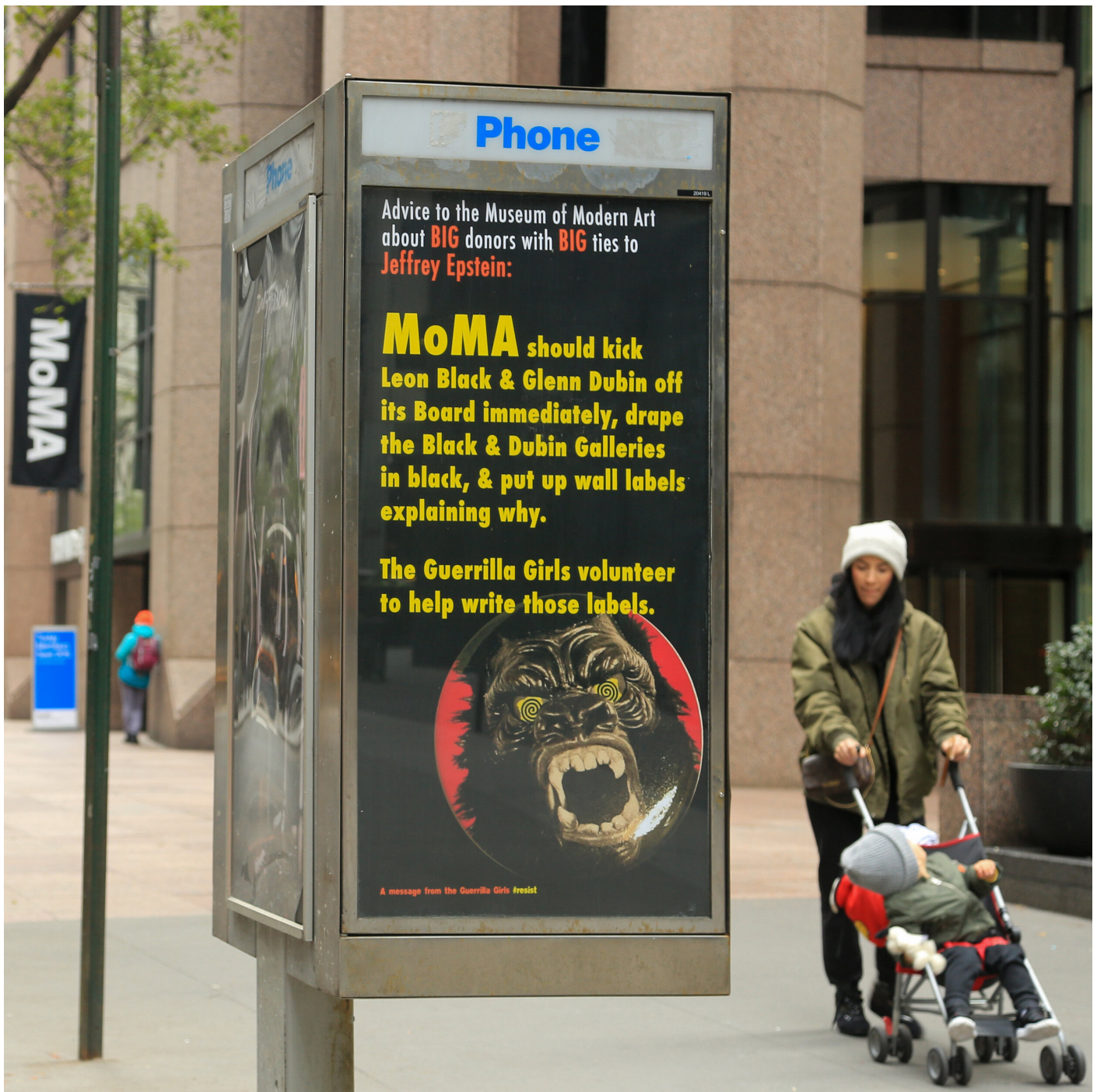
Guerrilla Girls, Jeffrey Epstein, Leon Black and MoMA, affiche dans les rues de New York, 2019

Conseil au Musée d'Art Moderne à propos des GRANDS mécènes qui ont des GRANDS liens avec Jeffrey Epstein: MoMA devrait éjecter immédiatement Leon Black et Glenn Dubin de leur conseil d'administration, recouvrir les Galleries Black et Dubin de noir, et afficher des textes au mur expliquant pourquoi. Les Guerrilla Girls se mettent à disposition pour la rédaction de ces textes.