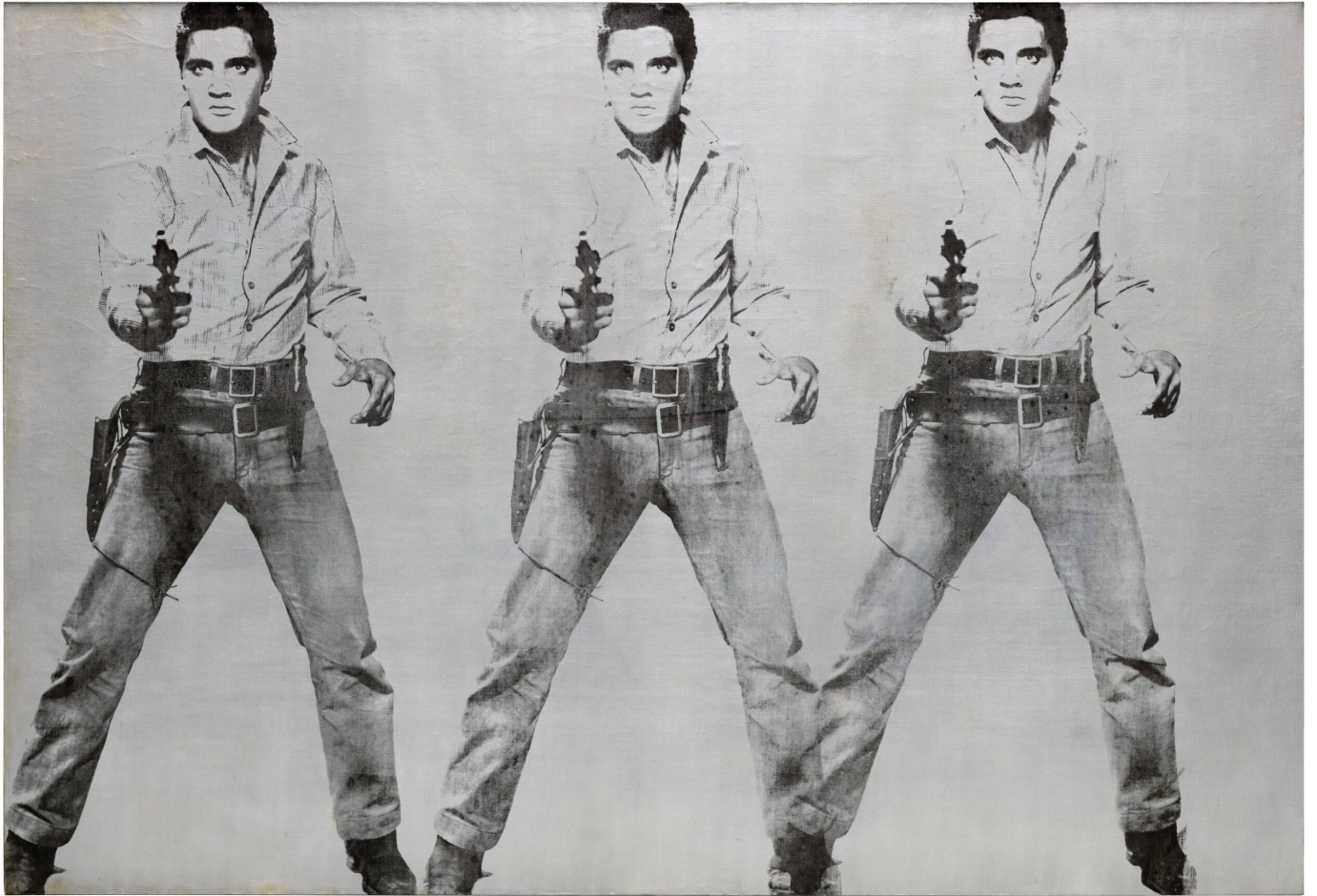
Andy Warhol, Triple Elvis , sérigraphie et peinture argentée sur toile, 209 cm x 301 cm, 1963 SFMOMA, San Francisco