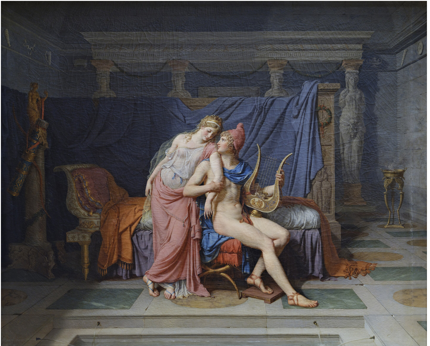
Jacques-Louis David , Les amours de Pâris et d'Hélène , huile sur toile, 147 cm x 180 cm, 1788, Musée du Louvre, Paris