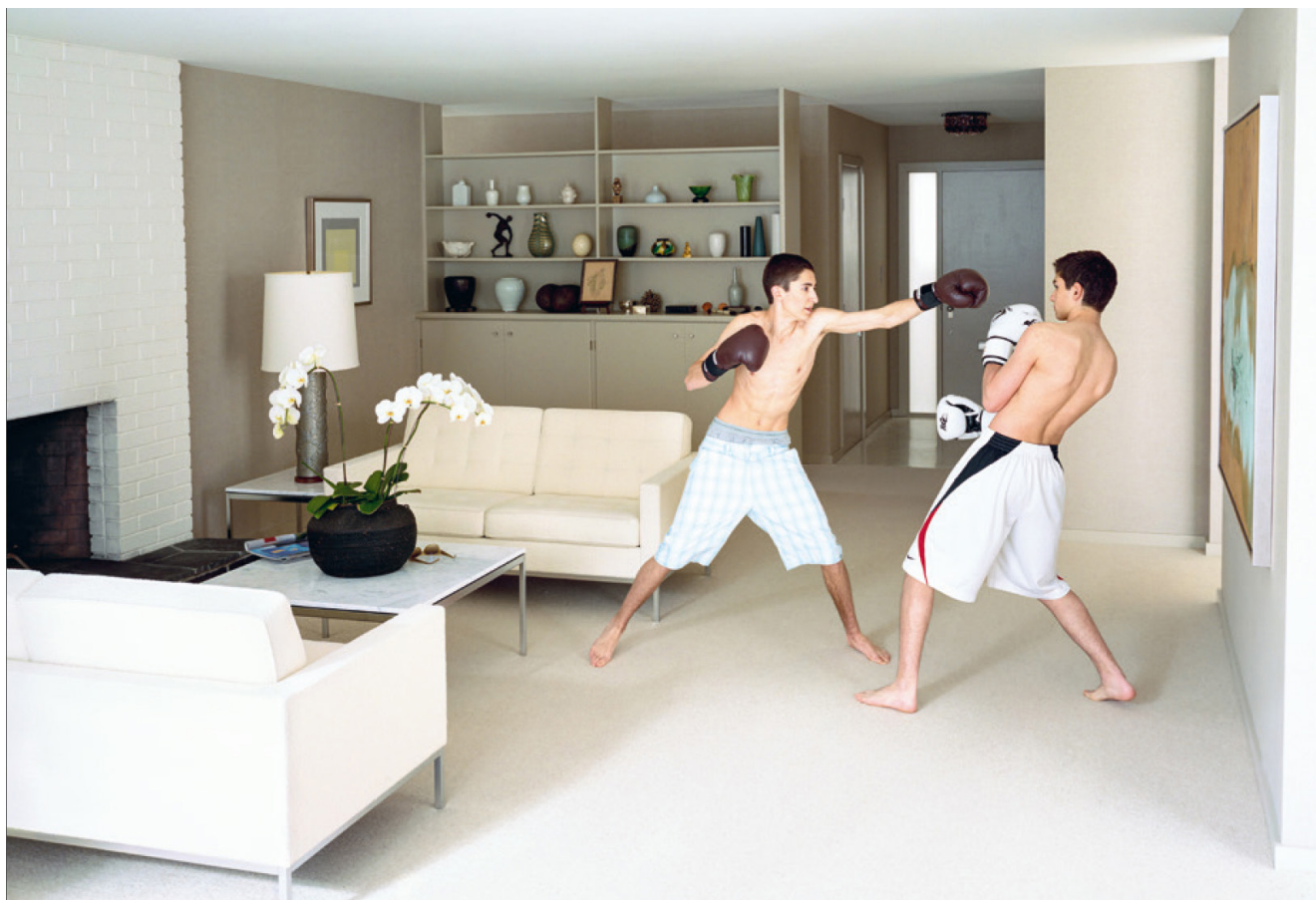
Jeff Wall , Boxing , photographie couleur, 215 cm x 295 cm, édition de trois exemplaires, 2011 propriété de l'artiste