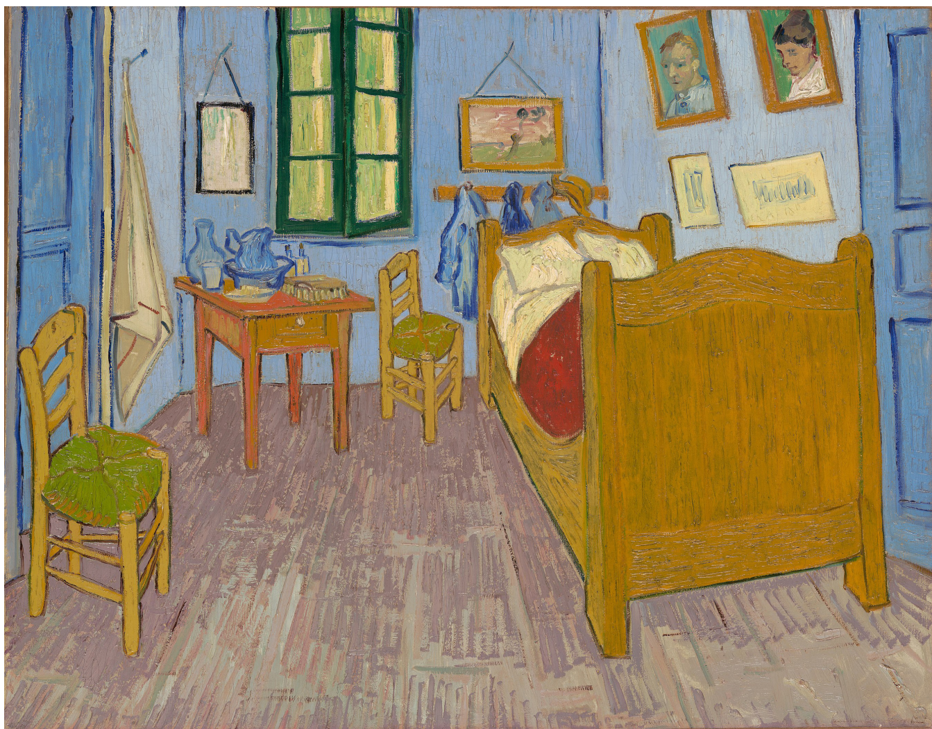
Vincent Van Gogh , La chambre à coucher (troisième version) , huile sur toile, 57,3 cm x 74 cm, 1889 Musée d'Orsay, Paris