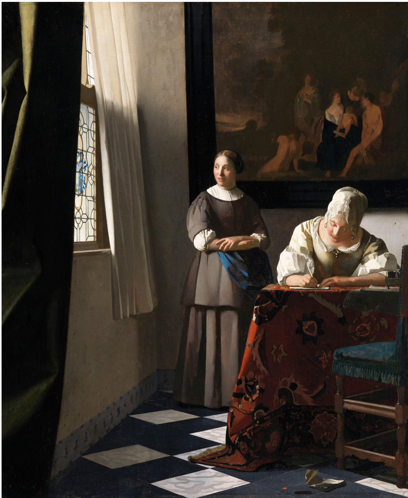
Johannes Vermeer , Femme écrivant une lettre et sa servante , huile sur toile, 71,1 cm x 60,5 cm, 1670-1671, Galerie nationale d'Irlande, Dublin